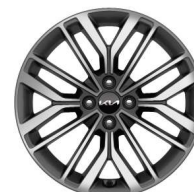
Jante aliaj 17" (C)