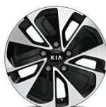
Jante aliaj 16" (tip D)