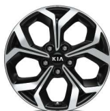
Jante aliaj 17" (tip A)